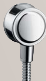
Coude de raccordement Fixfit® # 16884, -000, -820