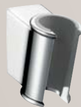
Porter Classic # 28324, -000, -820

Set de douche Croma® Classic 100 Multi avec flexible de douche Sensoflex® et barre de douche Unica® Classic 90 cm # 27768, -000, -820 65 cm # 27769, -000, -820 (sans ill.)